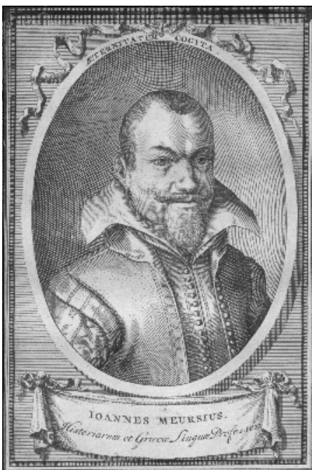
Figuur 1 Johannes Meursius (1579–1639)

Diegenen onder U die hier gekomen zijn om alvast een voorschot op hun weekend te nemen, hebben het bij het verkeerde eind gehad. De illustraties die U voor U heeft maken